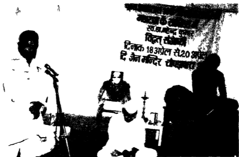
पूज्य उपाध्यायश्री क सानिध्य म अप्रैल ०४ म प जी क व्यक्तित्व और कृतित्व पर अम्बिकापुर म आयोजित सगाष्ठी म माइक पर बोलने ह। श्री सताप मार ३ यन २२ ह आर २२ २२२ नान ी चर्चा न